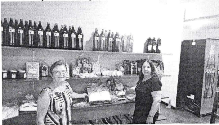
Local de exposição do artesanato da Associação dos Artesãos.

- Organização do espaço de exposição do artesanato da Associação dos Artesãos de Selbach, junto ao Dom Restaurante e Café, junto a RS 223, Km 36,5 Bairro Distrito Industrial para a divulgação do artesanato.